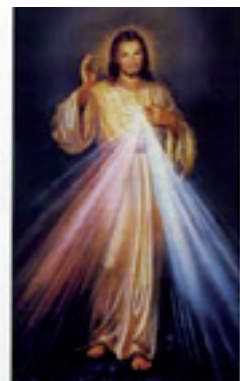
JESUS, J'AI CONFIANCE EN VOUS !

Cette fête a été instituée en 1985, tout d'abord pour l'Archidiocèse de Cracovie par son pasteur, Mgr le Cardinal Franciszek Macharski, puis célébrée dans quelques autres diocèses de Pologne. Dix ans plus tard, en 1995, le Saint Père Jean Paul II l'a étendue sur tous les diocèses de Pologne, à la demande expresse de l'Épiscopat de Pologne. Le 30 avril 2000, le deuxième dimanche de Pâques et le jour de la canonisation de sainte Faustine à Rome, le Souverain Pontife Jean Paul II l'a instituée pour l'Église universelle